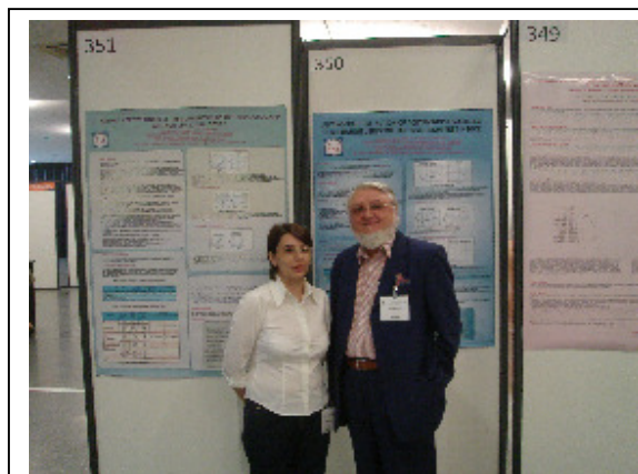
Postere ale membrilor AAR la Lisabona