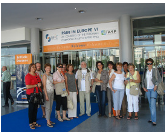
Participanți români la Congresul de durere Lisabona